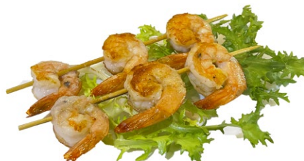
227. Spiedini di gamberoni* alla piastra