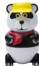
322. Pan dan gelato al gusto vaniglia .. € 5.00