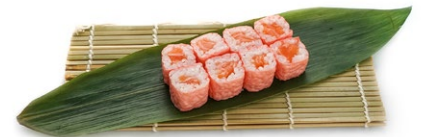
68. Sake philadelphia Salmone, philadelphia