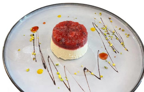
310. Miro frutti bosco