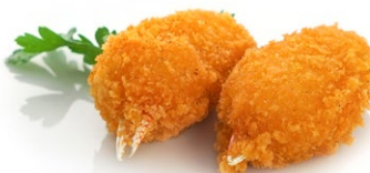
17. Granchio fritto* 2pz