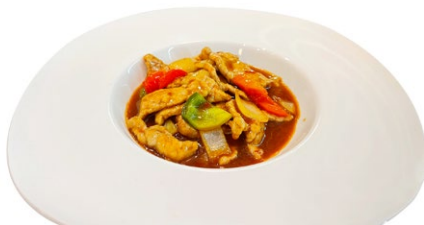
244. Vitello in salsa piccante