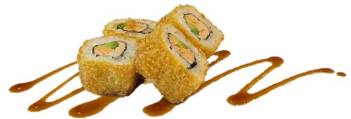
178. Sweet roll (ura fritti) 4pz Salmone, avocado, philadelphia