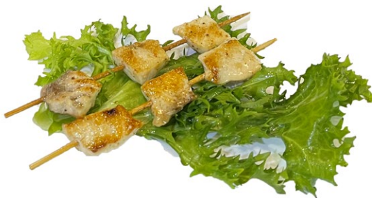
230. Spiedini di pesce spada alla griglia