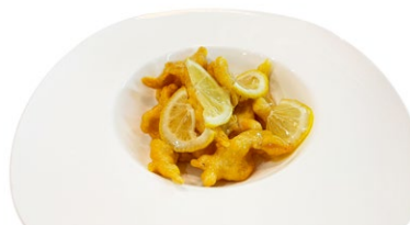
236. Pollo al limone