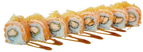
176. Sake fritti Salmone fritti, sopra salmone scottato, kataifi e salsa teriyaki