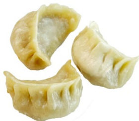
5. Ravioli di maiale* 3pz .. € 3.00 🌾