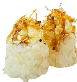
104. Nido phila