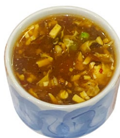
34. Zuppa agropiccante Zuppa con uova, tofu e verdura misto .. € 4.00 🌱🌱