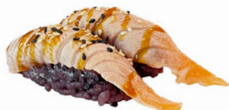
98. Nigiri sake cotto black Salmone scottato, sesamo, salsa teriyaki