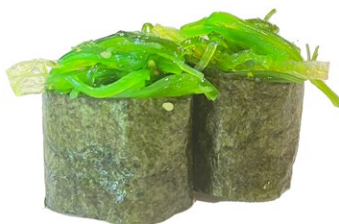
103. Nori wakame