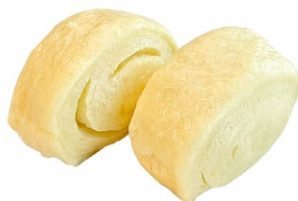
11. Bao zi 2pz