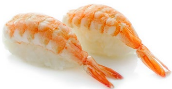
83. Nigiri ebi Gamberi* cotto