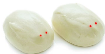
13. Pane di coniglio 2pz