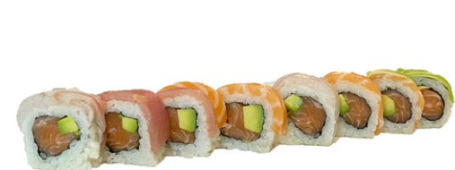
166. Rainbow Salmone, avacodo, sopra pesce misto