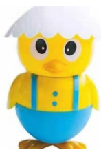
321. Twitty gelato al fiordilatte .. € 5.00