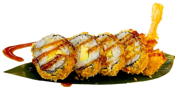
78. Futomaki ebi fritti Tempura di gamberi*, insalata, salsa teriyaki