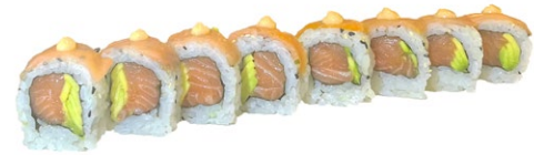
164. Affumicato Salmone, avocado, philadelphia, sopra salmone affumicato