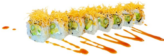
159. Ura special hai Asparago fritti, gamberi* cotto, philadelphia, kataifi e teiyaki