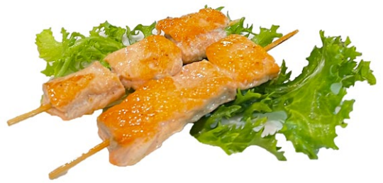
229. Spiedini di salmone alla griglia