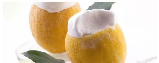
318. Limone ripieno frutto ripieno con sorbetto di limone .. € 6.00