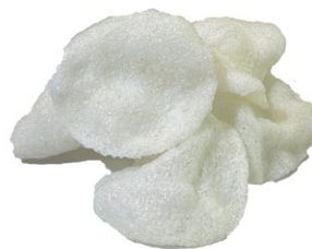
3. Nuvolette di gambero .. € 2.00 🌾 🍷