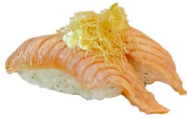
92. Nigiri sake kataifi Salmone scottato, kataifi, philadelphia, salsa teriyaki