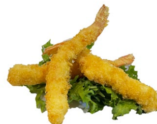
18. Ebi* fry 3pz