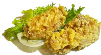
16. Alette di pollo