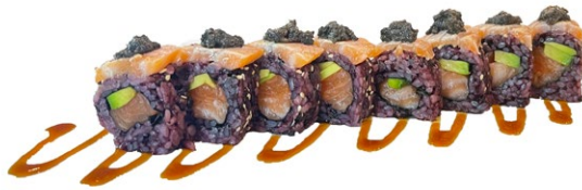
192. Panda tartufo Salmone, avacado, sopra salmone scottato, tartufo e salsa teriyaki .. € 12.00 🐟🥑🍄