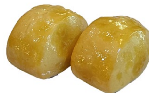
12. Pane cinese fritto 2pz