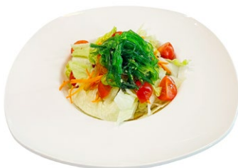
27. Yasai goma wakame Insalata misto con goma wakame, sesamo e salsa