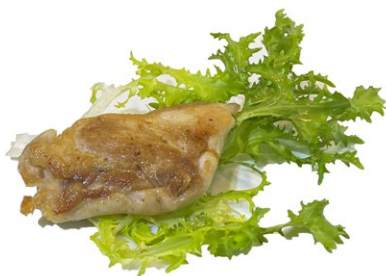
226. Cosce di pollo alla piastra