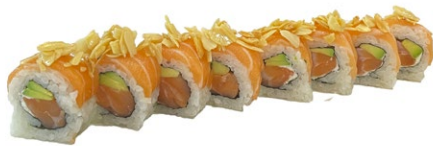
161. Sake mandorle Salmone, avocado, philadelphia, sopra salmone e mandorle