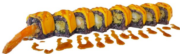
196. Ebi cheddar Tempura di gamberi*, cheddar e salsa teriyaki .. € 12.00 🌿🍤🧀