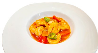
250. Gamberi salsa piccante Gamberi*, peperoni, cipolla e salsa piccante