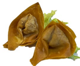
9. Wonton fritto* 3pz .. € 3.50 🌾