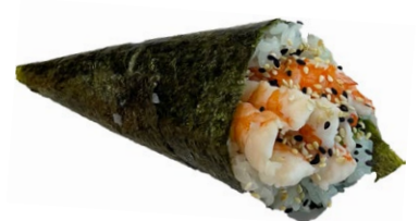
52. Ebi Gamberi* cotto, avocado .. € 3.50 🍤🌿