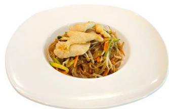
214. Tori spaghetti di soia Pollo, verdure miste