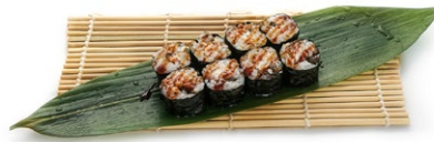
67. Sake chips Salmone fritti, kataifi e salsa teriyaki