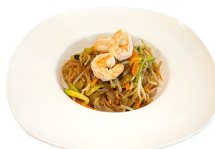
215. Ebi spaghetti di soia Gamberi*, verdure miste