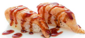
90. Nigiri sake cotto Salmone scottato, sesamo, salsa teriyaki