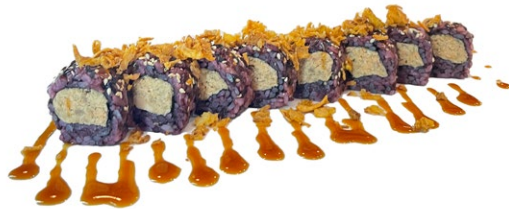
194. Miura roll Salmone cotto, avocado e salsa teriyaki .. € 8.00 🐟🥑🌿