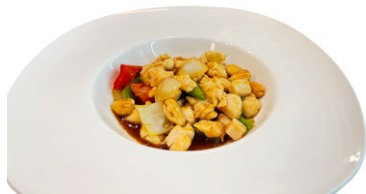
235. Pollo al mandorle