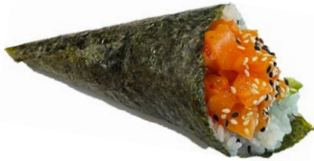
47. Sake spicy Salmon piccante, avocado .. € 3.50 🐟🌿