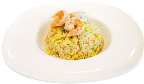
217. Riso saltato con gamberi Verdure miste, gamberi* e uova