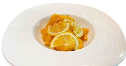
246. Gamberi* al limone