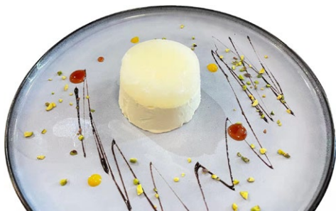
309. Miro limone