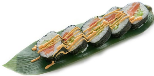
76. Futomaki max Salmone, tonno, surimi*, avocado e salsa spicy