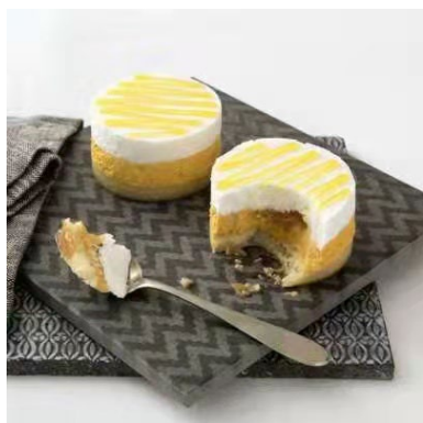
311. Agrumi di sicilia

crema semifredda al mandarino tardivo di ciaculli e crema semifredda ai limoni siciliani, con un cuore liquido agli agrumi, su una base di pan di spagna