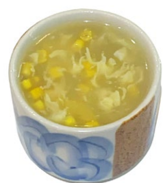
35. Zuppa mais Zuppa con uova e mais .. € 4.00 🌱