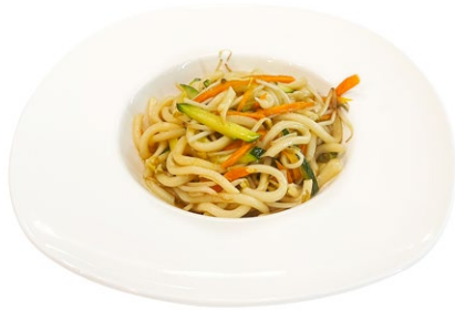
204. Yasai yaki udon Verdura miste