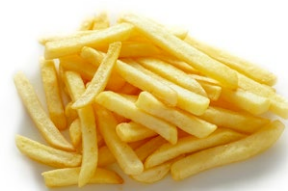
15. Patatine fritte*