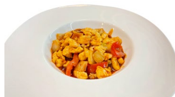
238. Pollo con salsa piccante

Pollo, peperoni, cipolla e salsa piccante