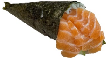
45. Sake Salmon, avocado .. € 3.50 🐟