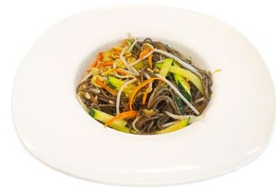
207. Yasai yaki soba Spaghetti di verdura, verdure e uova