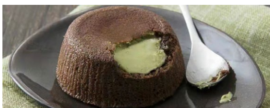
313. Souffle' al pistacchio

souffle' al cioccolato con cuore al pistacchio liquido