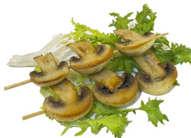
223. Spiedini di funghi alla piastra