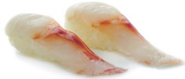
82. Nigiri suzuki Branzino