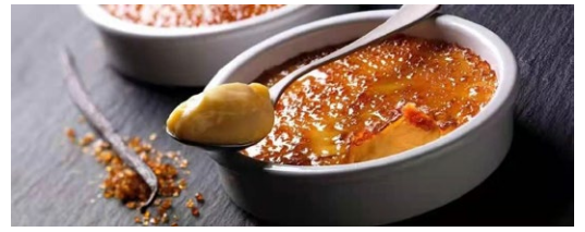
316. Crema catalana in cocchio crema catalana con zucchero caramellato .. € 6.00