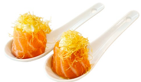
113. Gunkan kataifi Philadelphia, kataifi, esterno salmone