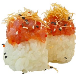
106. Nido maguro

Tonno piccante, kataifi, sesamo, teriyaki