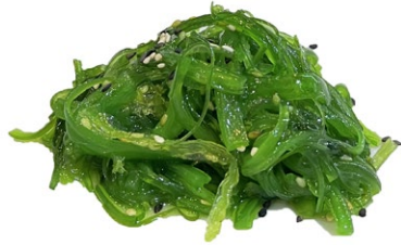
31. Goma wakame Insalata di alghe piccante .. € 4.00 🌱