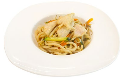
205. Tori yaki udon Pollo, verdura miste