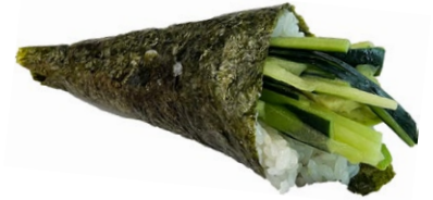
49. Vegetale Avocado, cetriolo .. € 3.00