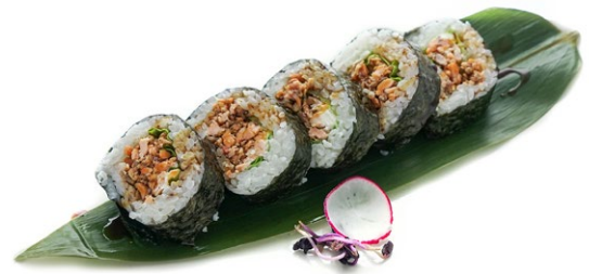
75. Futomaki cotto Salmone cotto, avocado e salsa teriyaki