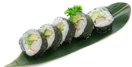
79. California Surimi di granchio*, avocado e maionese