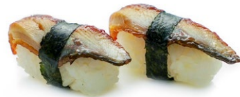
86. Nigiri unagi Anguilla*