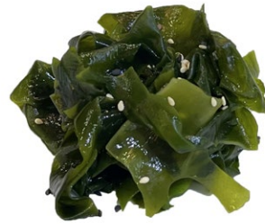
32. Wakame salada Insalata di alghe .. € 4.00 🌱