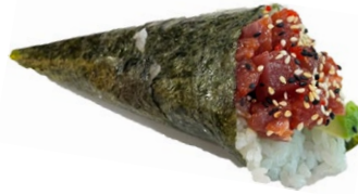
48. Tuna spicy Tonno piccante, avocado .. € 3.50 🐟🌿