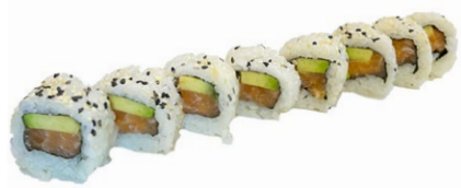
150. Ura sake Salmone, avocado