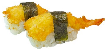
88. Nigiri ebi fritti Gamberi* fritti