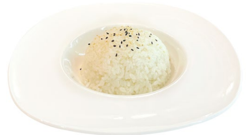
221. Riso bianco