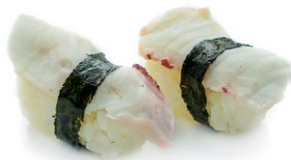
85. Nigiri tako Polpo*