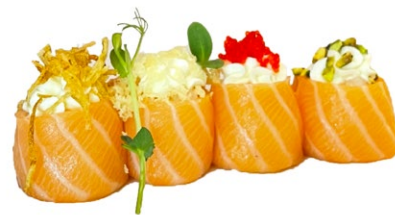
119. Gunkan mix Gunkan misto