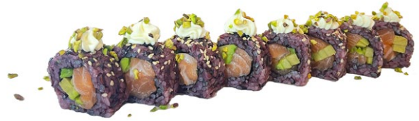
191. Panda phistacchio Avocado, salmone, sopra philadelphia e pistacchio .. € 8.00 🐟🥑🧀🌰