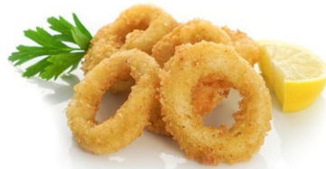
26. Ika fry 3pz Calamari* fritti