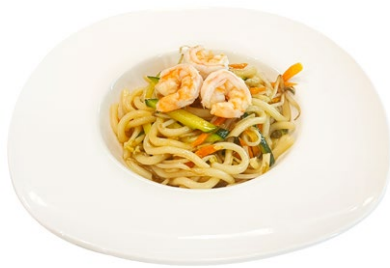
206. Ebi yaki udon Gamberi*, verdura miste