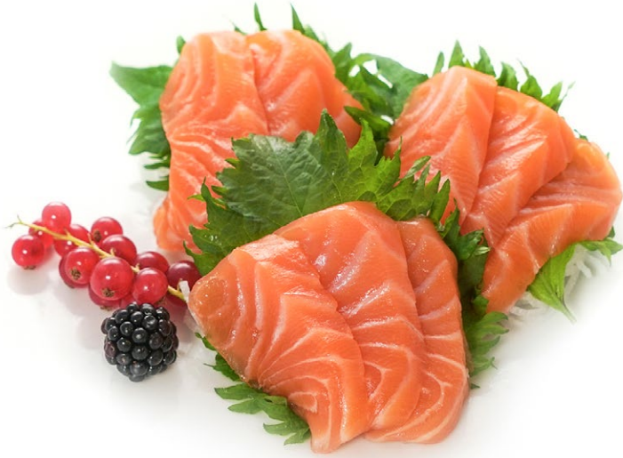
142. Sashimi salmone