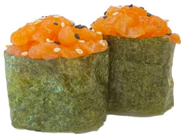
100. Nori sake