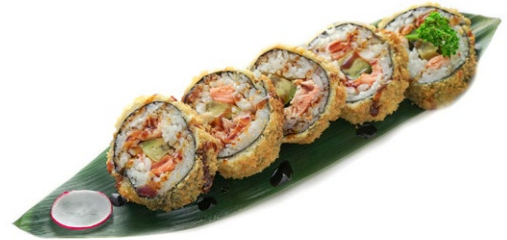
77. Futomaki fritti Salmone, avocado