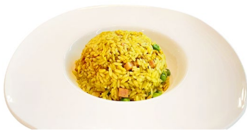
219. Riso saltato curry Prosciutto, piselli e uova