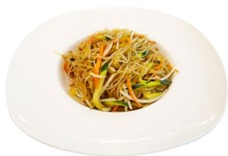
210. Yasai yaki spaghetti di riso Verdure miste e uova