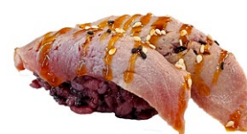
99. Nigiri maguro cotto black Tonno scottato, sesamo, salsa teriyaki