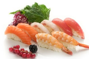
95. Nigiri mix 5pz Pesce misto