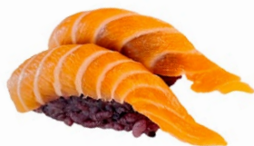
96. Nigiri sake black Salmone