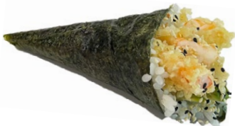
50. Ebi fritti Tempura di gamberi*, avocado e salsa teriyaki .. € 3.50 🌿🍤🌿