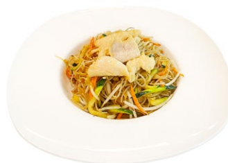
211. Tori yaki spaghetti di riso Pollo, verdure e uova