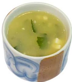
33. Miso shiru Tofu, alghe giapponese, erba cipollina .. € 3.00 🌱