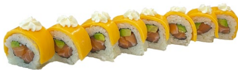
163. Cheddar Salmone, avocado, philadelphia, sopra cheddar e salsa teriyaki