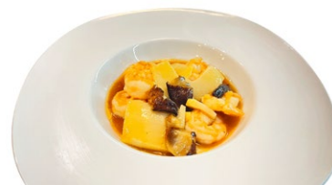
251. Gamberi* saltato con funghi e bambu