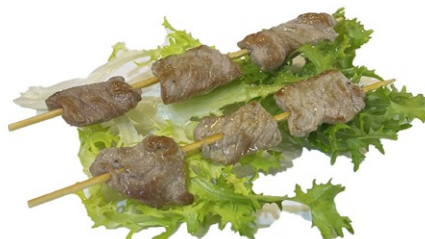
225. Spiedini di vitello alla piastra