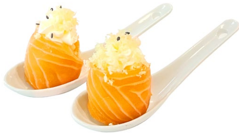
117. Gunkan special Philadelphia, tempura, salsa teriyaki