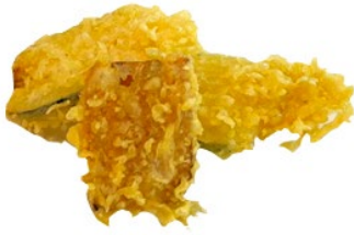
22. Tempura yashi 3pz