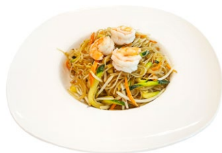
212. Ebi yaki spaghetti di riso Gamberi*, verdure e uova