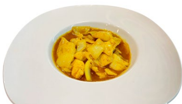
237. Pollo al curry