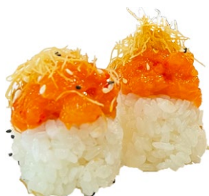
105. Nido sake

Salmon piccante, kataifi, sesamo, teriyaki