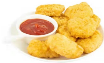
25. Tempura pollo Pollo fritto