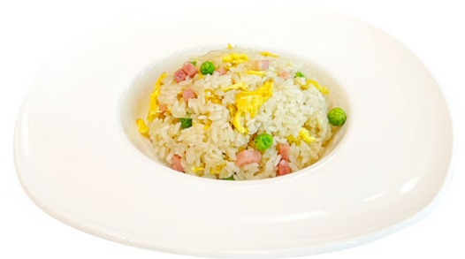
218. Riso alla cantonese Piselli, prosciutto cotto e uova