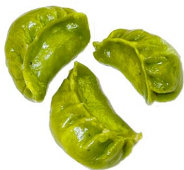
4. Ravioli di verdura* 3pz .. € 3.00 🌾