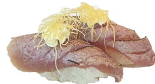
93. Nigiri maguro kataifi Tonno scottato, kataifi, philadelphia, salsa teriyaki