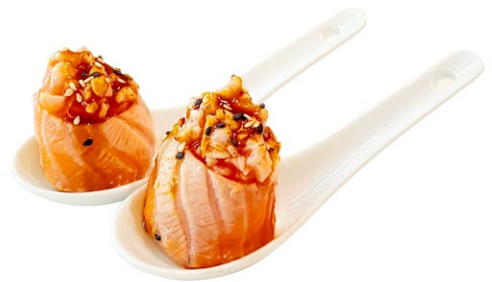
110. Gunkan frambe Tartar di salmone scottato, esterno salmone scottato, sesamo, salsa teriyaki