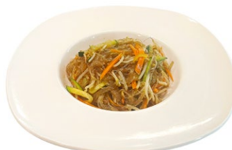
213. Yasai spagehetti di soia Verdure miste