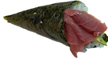
46. Maguro Tonno, avocado .. € 3.50 🐟