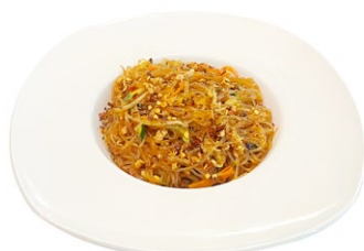
216. Spaghetti di soia piccante Carne di maiale macinato e verdure miste piccante