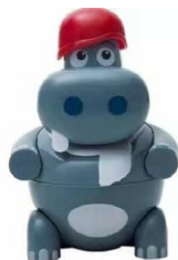
319. Hip pop gelato alla fragola .. € 5.00