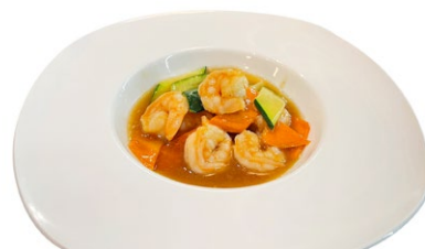
249. Gamberi* saltati con verdure