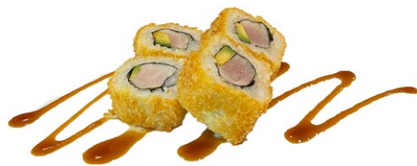
179. Kuroyo roll (ura fritti) 4pz Tonno, avocado, philadelphia