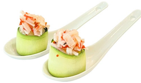
115. Gunkan zucchini Surimi*, gamberi* cotti, maionese e zucchine esterno