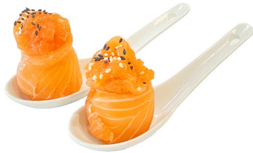
109. Gunkan sake Tartar di salmone, sesamo, esterno salmone