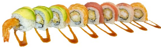
175. Ebi raibow Tempura di gamberi*, sopra pesce misto