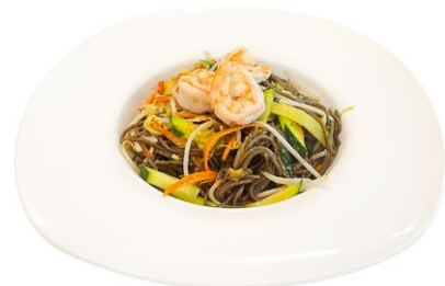
209. Ebi yaki soba Spaghetti di verdure, gamberi* e uova