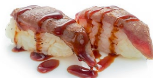
91. Nigiri maguro cotto Tonno scattato, sesamo, salsa teriyaki