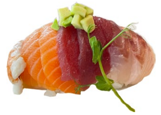
62. Chirashi misto Riso con pesce misto, sesamo, avocado