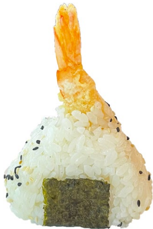
43. Tempura di gamberi Polpetta di riso con ripieno di gamberi* di tempura, salsa teriyaki