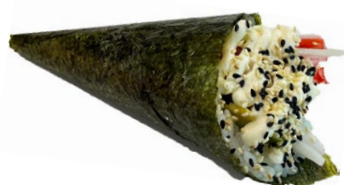
51. Surimi Surimi*, avocado .. € 3.00 🌿🌿