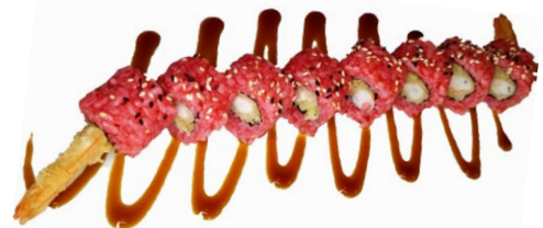
181. Color rise Riso, tempura gamberi*