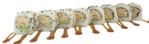
157. Ura miura Salmone cotto, avocado, kataifi, salsa teriyaki