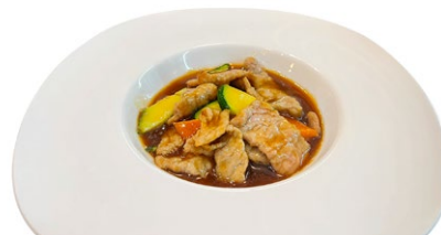
245. Vitello alla saltato con verdure