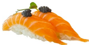
94. Nigiri sake tartufo Salmone scottato con tartufo e salsa teriyaki