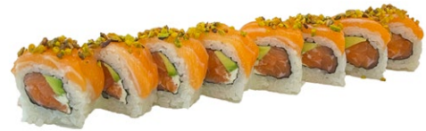
160. Sake pistacchio Salmone, avacado, philadelphia, sopra salmone e pistacchio