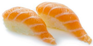
80. Nigiri sake Salmone