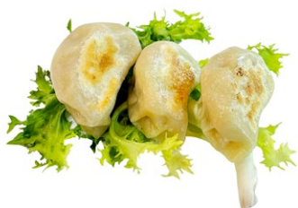
7. Gyoza maiale* 3pz .. € 4.00 🌾