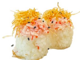
107. Nido surimi

Surimi*, maionese, sesamo, kataifi, teriyaki