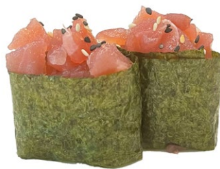
101. Nori maguro