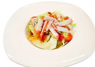
28. Insalata granchio Insalata polpa di surimi*, sesamo e salsa