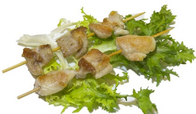
224. Spiedini di pollo alla piastra