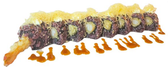
195. Ebi roll Tempura di gamberi*, philadelphia, patata fritti e salsa teriyaki .. € 10.00 🌿🍤🥑🍟