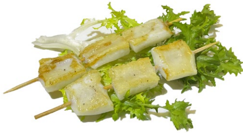
228. Spiedini di calamari*