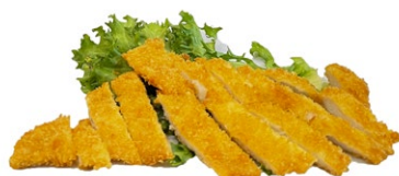
20. Katsu pollo