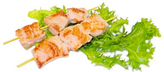
231. Spiedini di tonno alla griglia