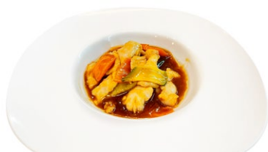
239. Pollo alla saltato con verdure