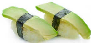
87. Nigiri avocado