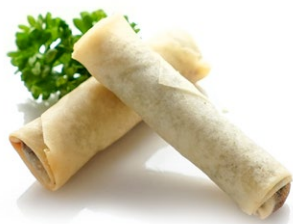
1. Harumaki 3pz Involtino primavera .. € 2.50 🌾