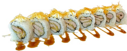
177. Tuna fritti Tonno fritti, philadelphia, kataifi e salsa teriyaki