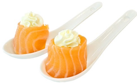
114. Gunkan phila Philadelphia, esterno salmone