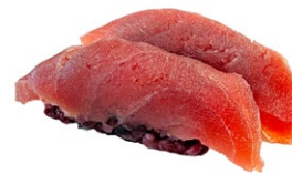
97. Nigiri maguro black Tonno