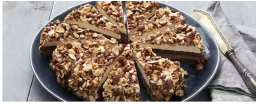
315. Torta al croccante Pan di spagna al cacao, crema alla nocciola e crema al cioccolato con cacao monorigine dell'ecuador, decorata con croccante granella di mandorla pralinata .. € 5.00