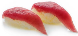
81. Nigiri maguro Tonno