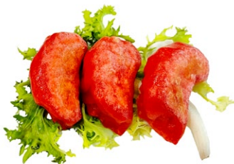
8. Gyoza pollo* 3pz Ravioli alla griglia con verdura e pollo .. € 4.00 🌾