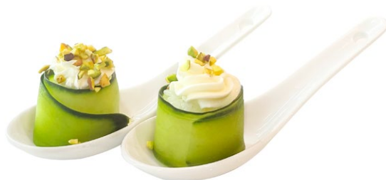
112. Gunkan green Philadelphia, pistacchio, esterno cetriolo