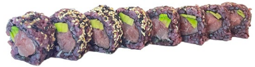
193. Maguro roll Avocado, tonno .. € 8.00 🐟🥑