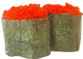
102. Nori tobiko