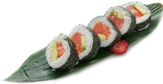
74. Futomaki Salmone, avocado € 6.00