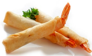
2. Ebi stick* 3pz .. € 4.00 🌾 🍷