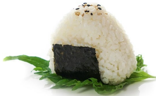
44. Unagi Polpetta di riso con ripieno di anguilla*, salsa teriyaki