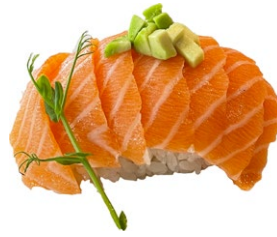
61. Chirashi sake Riso con salmone, sesamo, avocado