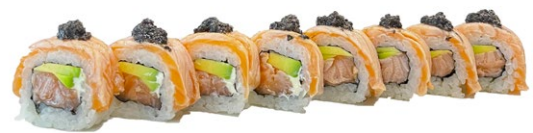
162. Sake tartufo Salmone, avocado, philadelphia, sopra salmone scottato tartufo e salsa teriyaki