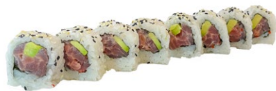
151. Ura maguro Tonno, avocado