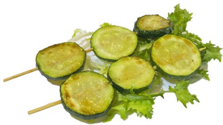
222. Spiedini di zucchini alla piastra