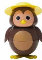
320. Cip ciok gelato al cioccolato .. € 5.00