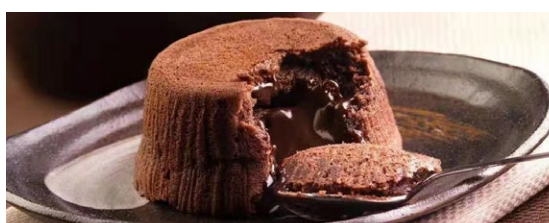
314. Souffle' al cioccolato

souffle' con cuore di cioccolato liquido