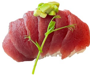
60. Chirashi tuna Riso con tonno, sesamo, avocado