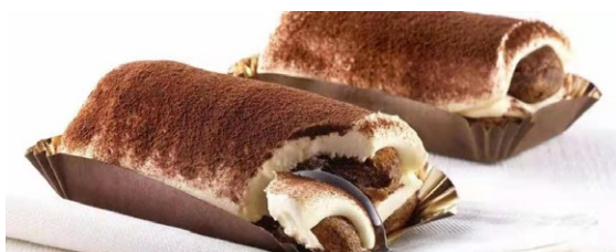
312. Tiramisu' con savoiardi

crema al mascarpone e savoiardi inzuppati al caffè'