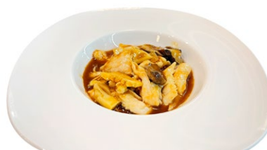
241. Pollo saltato con funghi e bambu