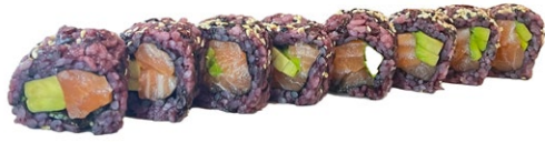
190. Panda roll Avocado, salmone .. € 8.00 🐟🥑