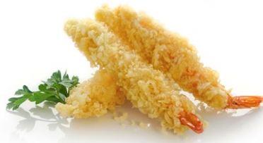
23. Tempura ebi* 3pz