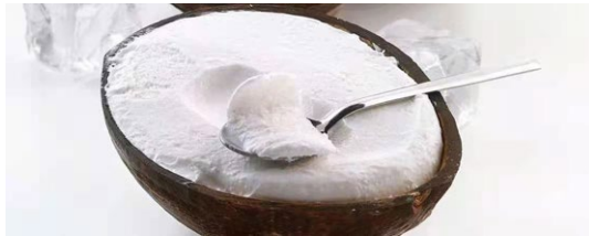
317. Cocco ripieno noce di cocco ripiena con gelato al cocco .. € 6.00