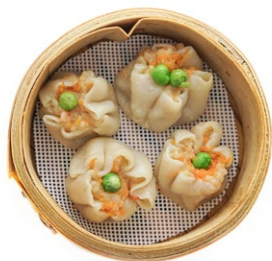
10. Siu mai* 3pz