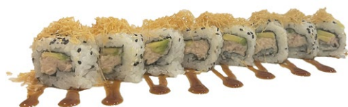
156. Ura tuna Tonno cotto, avocado, kataifi, salsa teriyaki