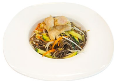
208. Tori yaki soba Spaghetti di verdure, pollo e uova