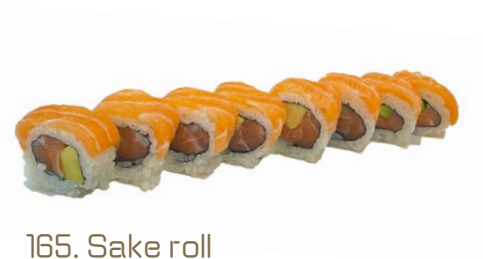
165. Sake roll Salmone, avacodo, sopra salmone